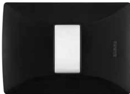
Negro Obsidiana (QZ4803M1NR)